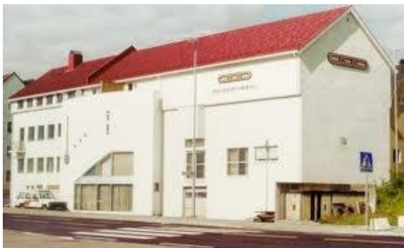
Logehuset i Molde.