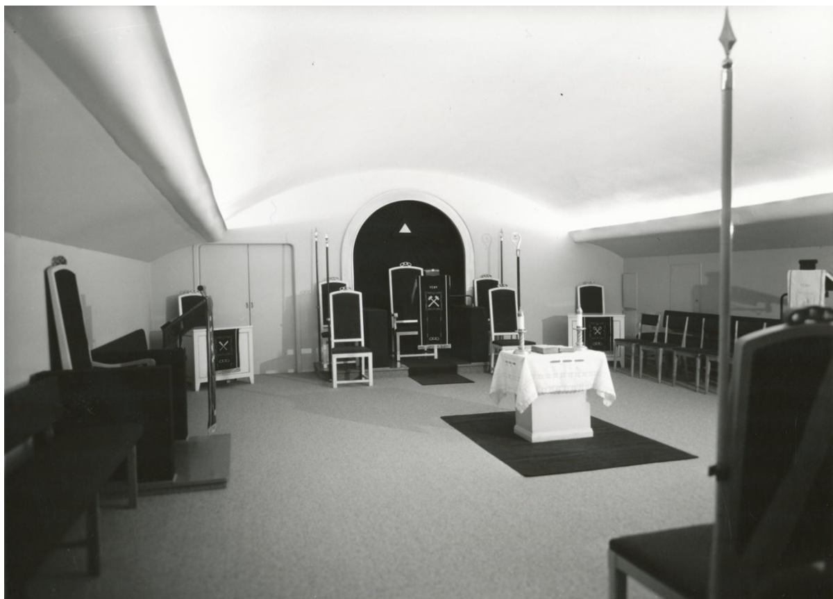
Logesalen i Lønsethgården.